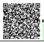
ふじのくに電子申請QRコード

ホームページ「体験・出前授業カレンダー」で日程を御確認のうえ、 ふじのくに電子申請 において必要事項を入力後送信ください。予約確定後電話連絡します。