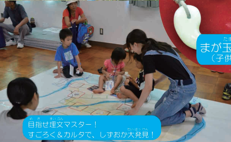
めじ まいぶん 目指せ埋文マスター! すごろく&カルタで、しずおか大発見!