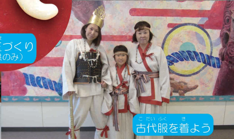
こ たい ふく き 古代服を着よう