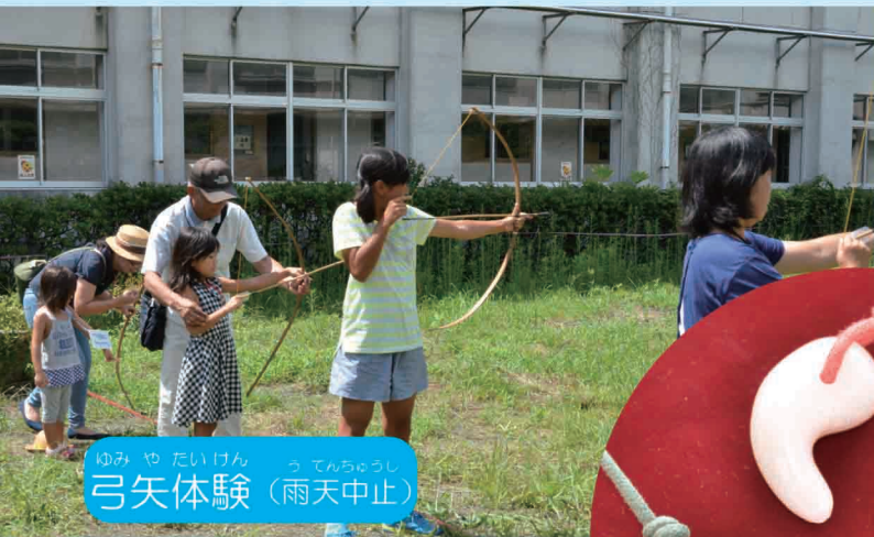
ゆみ や たいけん 弓矢体験 (雨天中止)