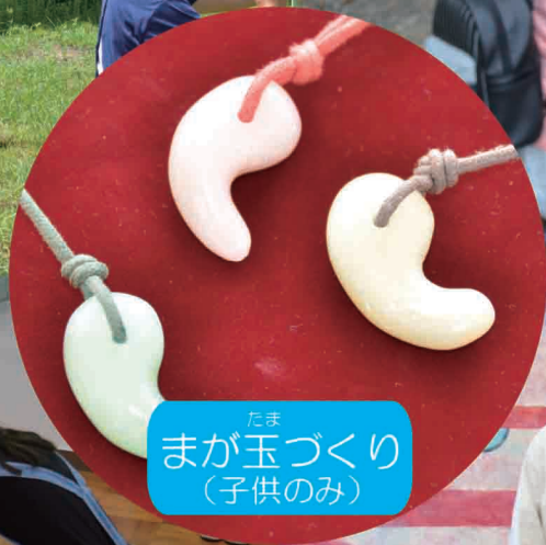
たま まが玉づくり (子供のみ)