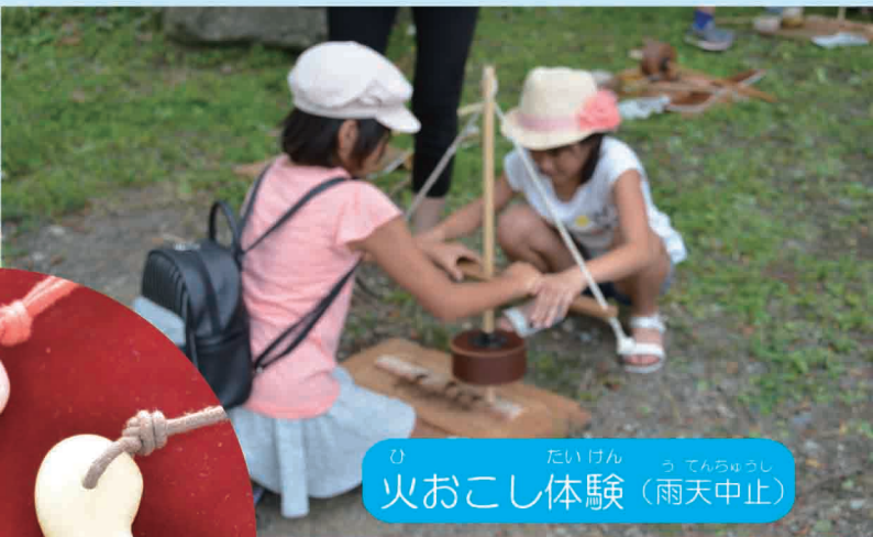
ひ たいけん 火おこし体験 (雨天中止)