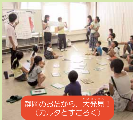
だいはっけん 静岡のおたから、大発見! (カルタとすごろく)