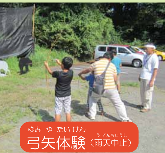
ゆみ や たいけん うてんちゅうし 弓矢体験 (雨天中止)