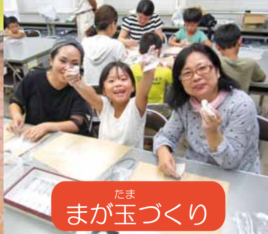
たま まが玉づくり