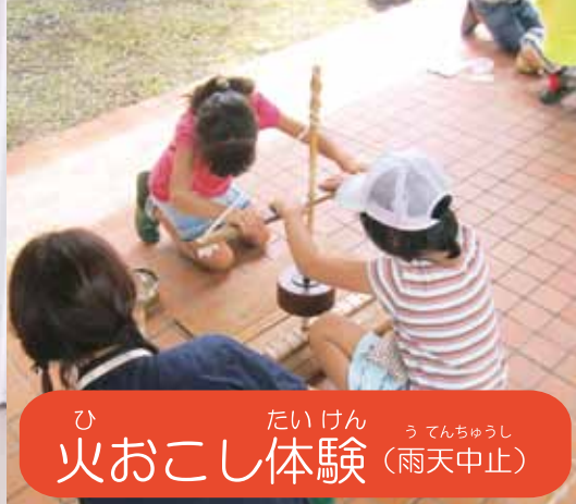
ひ たいけん うてんちゅうし 火おこし体験 (雨天中止)