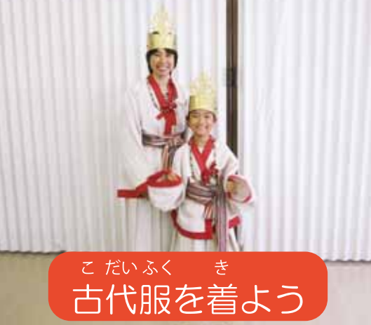
こ だい ふく き 古代服を着よう