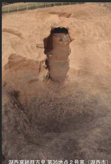
湖西窯跡群古見 第36地点2号窯（湖西市）