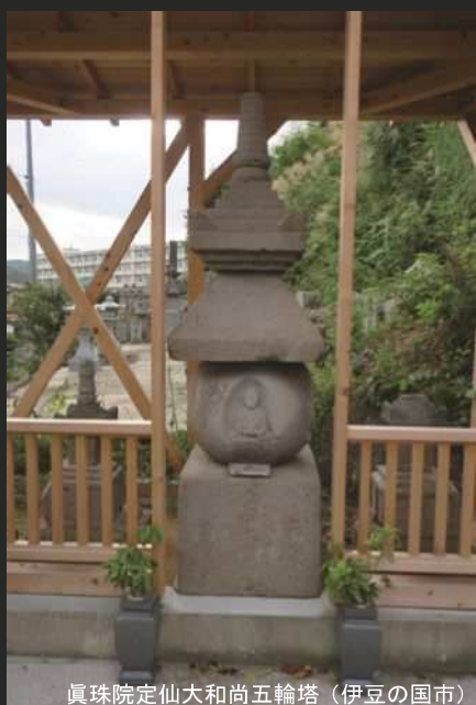
真珠院定仙大和尚五輪塔（伊豆の国市）