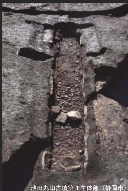
池田丸山古墳第1主体部（静岡市）