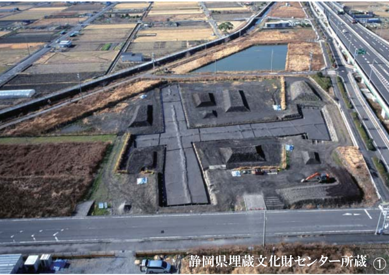
静岡県埋蔵文化財センター所蔵 ①